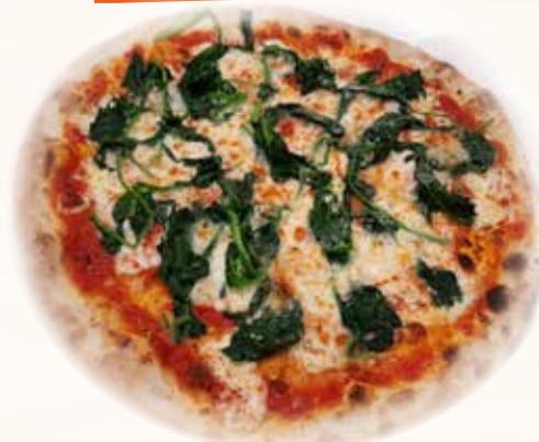
Braccio di Ferro