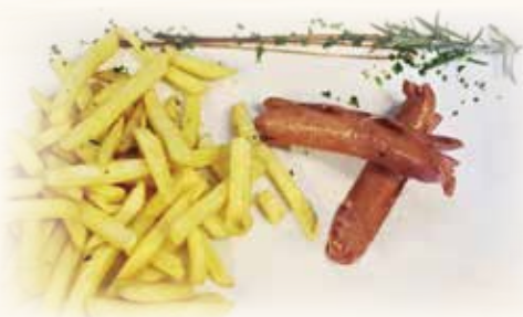
Würstel e patatine

Pomodoro Mutti polpa, mozzarella Fior di Latte, patatine fritte e Würstel