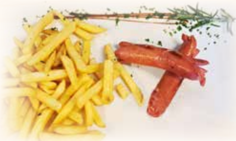
Würstel e patatine